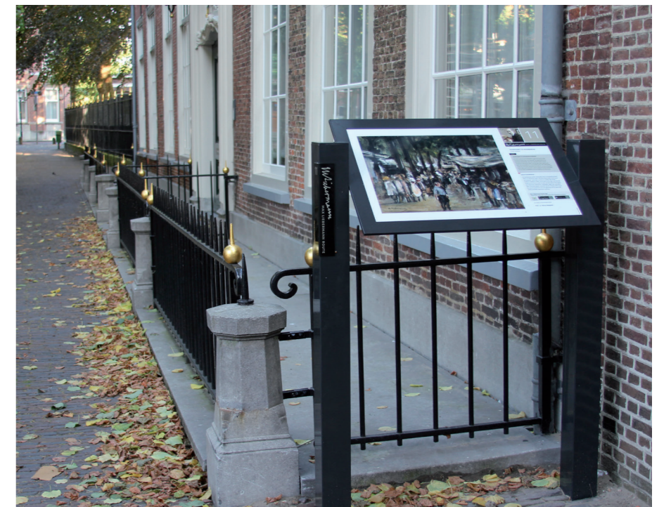
Metalen staanders in de historische dorpskern