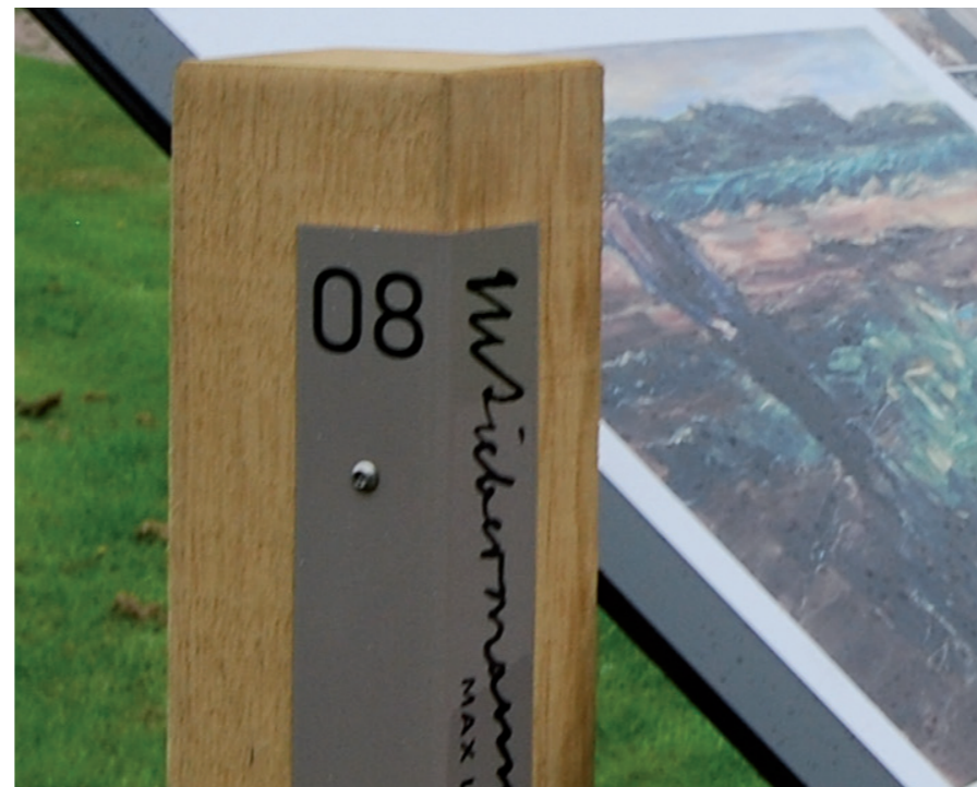
Vouwpaneel met titel en routenummer