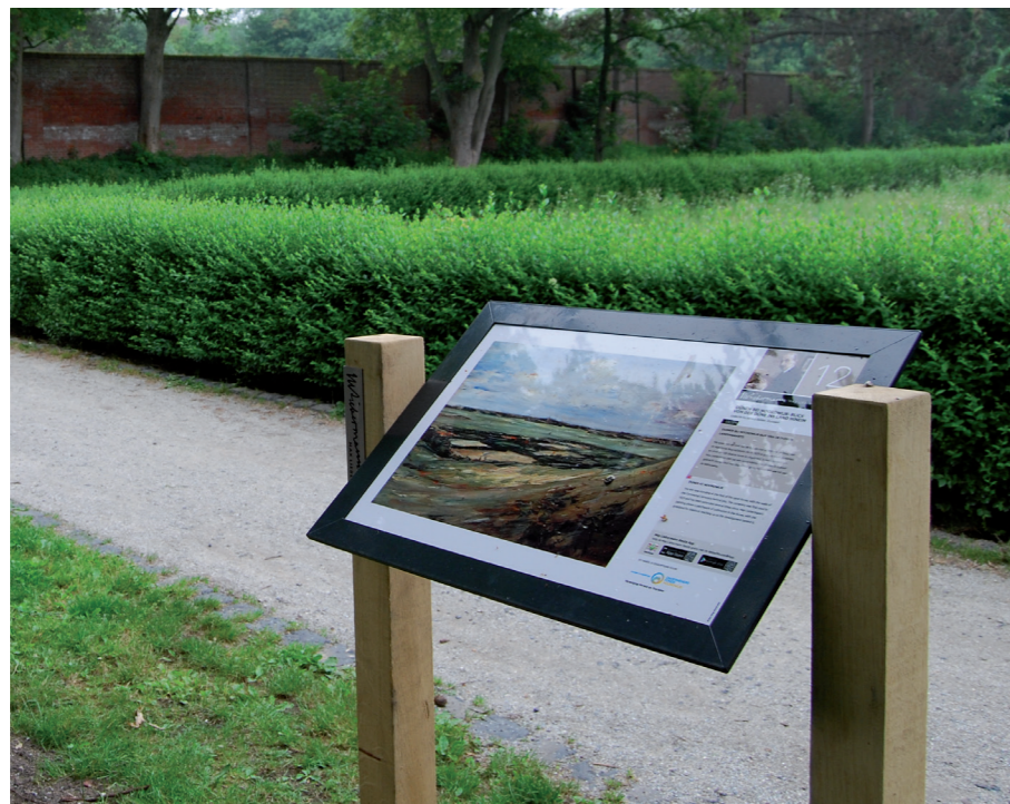
Eikenhouten staanders buiten de bebouwde kom